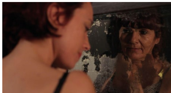
Figura 2. Rua dos Anjos (2022), 84 minutos, de Maria Roxo e Renata Ferraz. Frame 00:52s

A dinâmica entre Maria e Renata na frente e atrás da câmera sugere uma multiplicidade de funções. Como aponta Barbon (2010, p.7), “o sujeito trans-